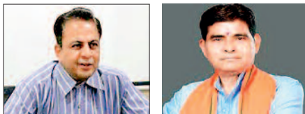
हरिभूमि न्यूज | बलौदाबाजार

जिले के समग्र विकास, चुनौतियों और भविष्य की संभावनाओं पर व्यापक चर्चा के उद्देश्य से हरिभूमि-आईएनएच द्वारा "जिला संवाद 2026" कार्यक्रम आज सुबह 11 बजे से स्थानीय ऑडिटोरियम में किया जाएगा। इस विशेष कार्यक्रम में राज्य सरकार के दो वर्ष पूर्ण होने के अवसर पर जिले में हुए विकास कार्यों, संचालित योजनाओं तथा आम जनता से जुड़ी प्रमुख समस्याओं पर विस्तृत मंथन शेष पेज 7 पर