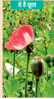
ये है फूल