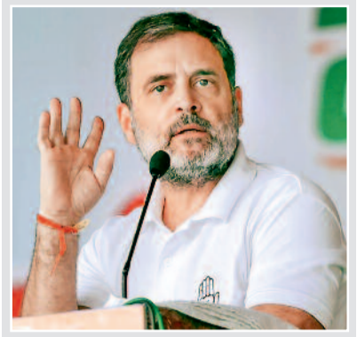
नई दिल्ली

नई दिल्ली। कांग्रेस नेता राहुल गांधी ने केरल में संयुक्त लोकतांत्रिक मोर्चा (यूडीएफ) की जीत का भरोसा व्यक्त करते हुए शुक्रवार को कहा कि राज्य के लोग बदलाव के लिए तैयार हैं। उन्होंने 'एक्स' पर एक पोस्ट में कहा, "टीएमसी ही टीम केरलम है। गांधी ने अपनी पोस्ट में कहा, "प्रत्येक उम्मीदवार केरल के लोगों की आवाज, आकांक्षाओं और विश्वास का प्रतिनिधित्व करता है। यह अनुभवी नेताओं और युवा परिवर्तनकर्ताओं का एक समूह है - पुरुषों और महिलाओं को एक मजबूत टीम जो अपने प्रतिनिधित्व वाले निर्वाचन क्षेत्रों की बारीकियों को समझती है।" वायनाड के पूर्व सांसद ने कहा, "मेरे लिए केरल मेरा घर है और केरल के लोग मेरा परिवार हैं। मैंने यहाँ के लोगों से जो कुछ भी सीखा है और जिस प्यार एवं स्नेह से उन्होंने मुझे अपनाया है, उसके लिए मैं उनका बहुत आभारी हूँ - हमेशा आपका साथी रहूँगा।