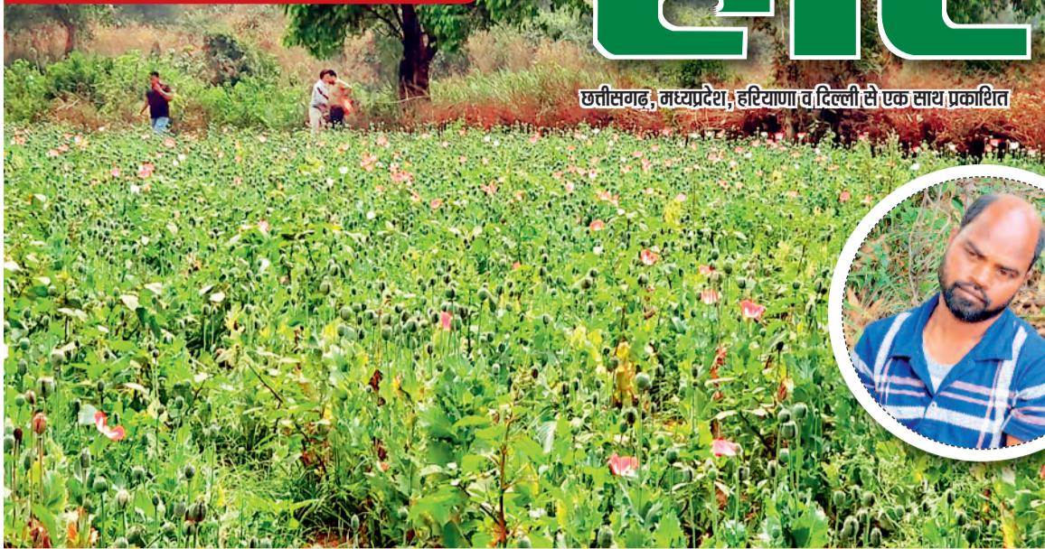
छत्तीसगढ़, मध्यप्रदेश, हरियाणा व दिल्ली से एक साथ प्रकाशित

अंतरराज्यीय नेटवर्क का हो सकता है खुलासा